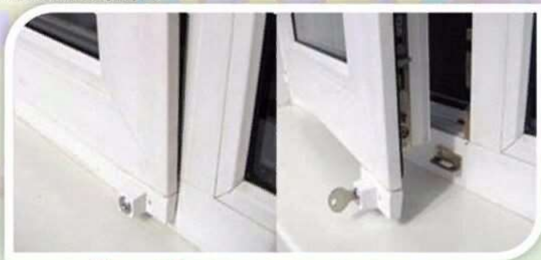
Замок блокировщик с ключом

Можно воспользоваться специальными замками блокираторами, которые предлагают установщики пластиковых окон.